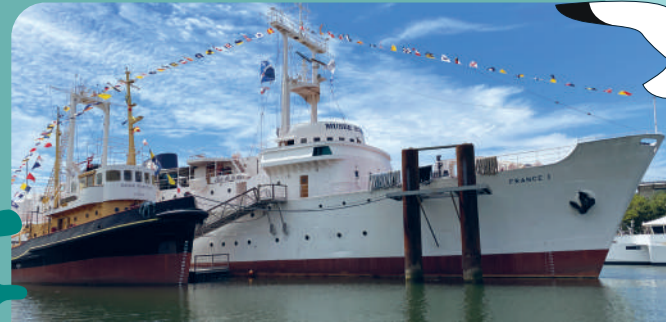
Musées - Musée Maritime de La Rochelle