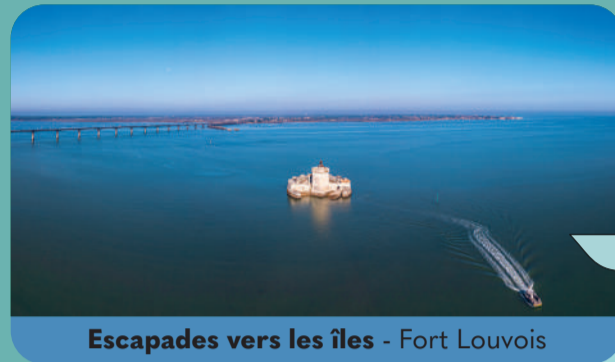
Escapades vers les îles - Fort Louvois