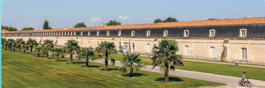
Sites historiques - Corderie Royale de Rochefort