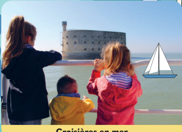
Croisières en mer