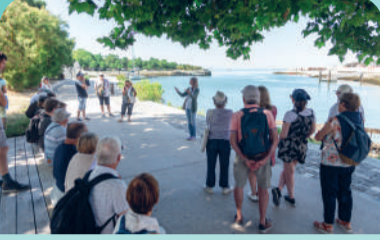
Visites guidées - La Rochelle, Saintes, Brouage