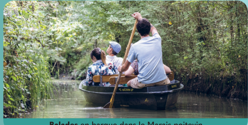
Balades en barque dans le Marais poitevin